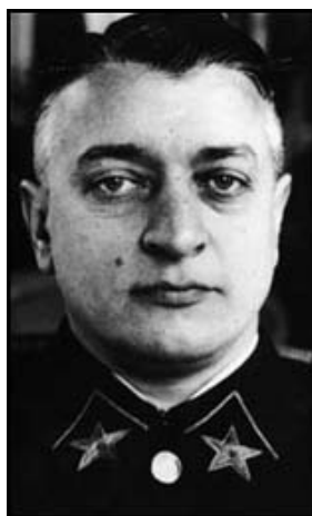
Mikhail Tukhachevsky som Marskal af Sovjetunionen op mod hans arrestation og henrettelse i 1937

Tukhachevsky blev placeret igen som chef for de væbnede styrker, og kom som sådan kom til at inspirere og lede opbygningen af en moderne militærindustri og forberedelserne til mobilisering af det civile produktionsapparat til konvertering til militærproduktion. Det var en kaotisk og brutal proces. Den forløb parallelt med de første Femårsplaners brutale indsats for på få år at opbygge en sværindustri infrastruktur og produktionsapparat. Begge skulle i stor udstrækning placeres på "bar mark", udenfor rækkevidden af fjendtlige invaderende styrker og bombefly. Virksomhedsledere og ingeniører blev holdt motiveret af frygt ved regelmæssige udrensninger. Arbejdskraften kom til rådighed som et bevidst resultat af tvangskollektivering, der dels leverede slavearbejdere til infrastrukturprojekterne, og dels i kraft af den medfølgende hungersnød, der førte til flugt fra land til by og således forøgede antallet af industriarbejdere.