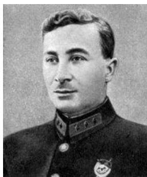
Den brillante teoretiker Triandafillov

Allerede under denne forberedende periode samlede Tukhachevsky en gruppe af selvstændigt tænkende, personligt dynamiske og effektive officerer omkring sig. Den ledende teoretiker var den ét år yngre Vladimir Kiryakovich Triandafillov , der ligesom Tukhachevsky kom til den Røde Hær med en baggrund som ung officer i Tsarhæren. Han havde deltaget under Tukhachevsky under Tambov-operationen og var fra 1924 operationssektionschef i hovedstaben. I 1928 blev han stedfortrædende stabschef.