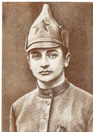
Mikhail Tukhachevsky som 'Rød Chef' og leder af 'strategisk rejsehold' omkring 1920

Tukhachevsky sluttede sig som russisk nationalist til bolsjevikkerne, fordi han vurderede, at kun de havde den brutale viljestyrke, der var nødvendig for at modernisere landet og dets væbnede styrker. Han imponerede Lenin og opnåede, på trods af, at han i 1918 kun fyldte 25, at blive den mest respekterede og anvendte "Røde Chef". Som et en-mands 'rejsehold' blev han udsendt som overordnet militær chef - under Borgerkrigen til Sibirien og derefter Krim, til felttoget mod Polen, til pacificeringen af det opfattende Tambov-bondeoprør og til nedkæmpelsen af Kronstadt-matrosernes oprør. Derefter blev han fra 1922 en central person i opbygningen af det tysk-sovjetiske militære samarbejde. De tyske militære ledere erkendte herunder hans potentiale som modspiller og intrigerede derefter for at svække hans indflydelse. Tukhachevsky fungerede fra 1924 til 1928 som stedfortrædende krigskommissær (forsvarsminister) og chef for den røde hærs hovedstab. Mod slutningen af perioden fremlagde han sine tanker for opbygningen af de sovjetiske væbnede styrker.