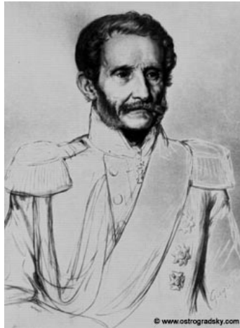
Den ældre Henri Jomini, der i afgørende grad kom til at inspirere udviklingen af russisk og sovjetisk militærteori.

Det forhold, at Rusland skabte et generalstabsakademi og begyndte at uddanne generalstabsofficerer, fik dog i Tsartiden primært indflydelse på udviklingen af den russiske operative teori. Generalstabsofficerskorpset blev på intet tidspunkt en dominerende elite inden for det massive officerskorps. Man måtte konkurrere om indflydelse med garderegimenternes og artilleriofficerskorpsets allerede eksisterende elitegrupper. Samlet forholdt alle disse elitegrupper i Sankt Petersborg - med deres konkurrence om gunst og indflydelse - til den store grå masse af faste officerer i provinsen som en olieplet på oceanet, man flød oven på, kunne ikke blandes med det. Denne distance mellem hærens top og masse var dog ikke kun en funktion af de sociale strukturer i Tsarriget. Landets enorme udstrækning og meget svage infrastruktur medførte, at provinsen på alle områder måtte klare sig selv, leve sit eget liv.