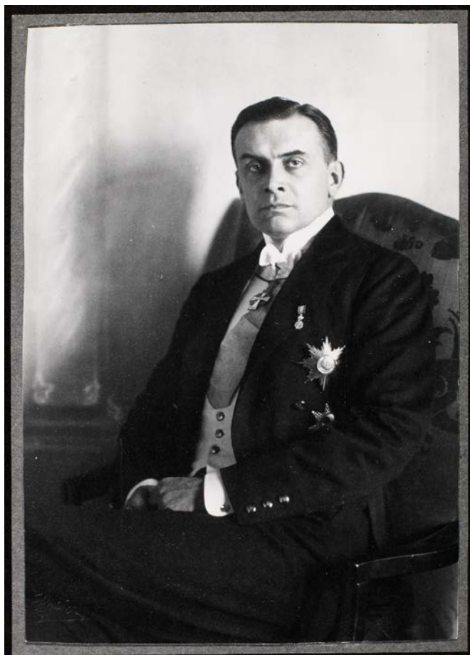
Grev Carl Moltke, den danske gesandt i Berlin siden efteråret 1912, som af Consett blev karakteriseret som meget tyskvenlig, og så MI5(g) mistænkte for at arbejde for den tyske efterretningstjeneste sammen med halvbroren i London og svigerinden i Danmark..