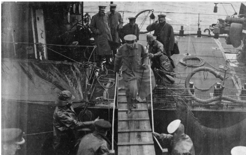
Mødet blev holdt i rammen af rygter om forløbet i Jyllandslaget og om årsagen til ekspositionen på Hampshire . Kitchener et par timer før sin død på vej til frokost med Grand Fleets øverstkommanderende, admiral Jellicoe, om bord på dennes flagskib HMS Iron Duke .

Der er fundet to kilder til, hvad der skete på mødet. De er umiddelbart set uenige om, hvem der tog initiativet til frokostsamtalet. Indberetningen fra den danske gesandt, grev Henrik Grevenkop-Castenskiold, oplyser, at det var Stagg, der