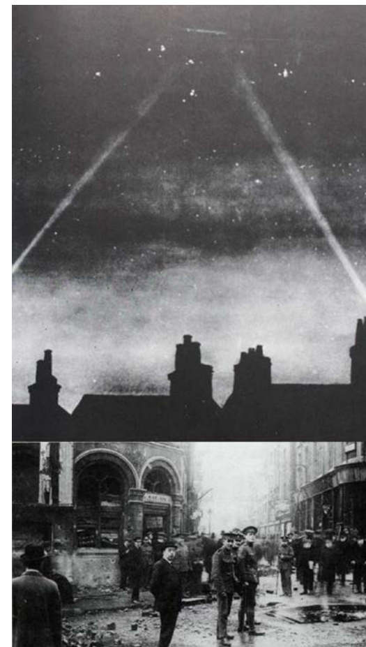
Hvad Moltke oplevede den 13. oktober 1915: L.15 bombardementet af London. (Fotos fra Robinson, The Zeppelin in Combat , samt fra Osprey-bogen: London 1914-17 om bombeskaden ved hjørnet at Exeter Street og Wellington Street.)