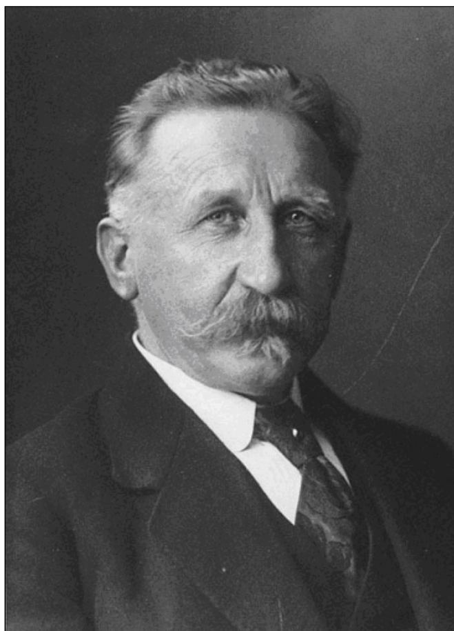
Den sønderjyske leder, medlem af den tyske Rigsdag fra 1906, Hans Peter Hanssen. Den danske generalstabs agent 'Z' fra 1901 til 1918.